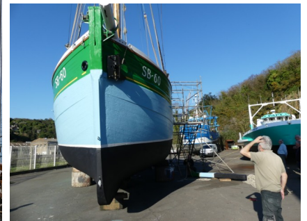
Carénage au Légué, Sortie technique