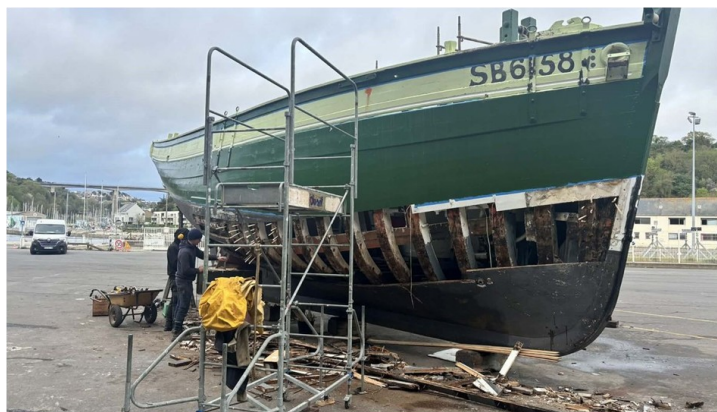
Le Grand Léjon en travaux et bientôt de retour sur les mers